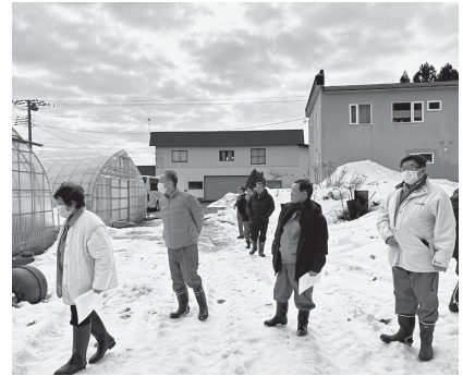
視察風景（2月27日、稲垣地区）