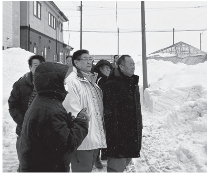
視察風景（2月6日、柏地区）

リンゴ樹の枝折れ等については、現時点で大きな被害は確認されていないとの説明を受けて安堵した一方、倒壊した農業用ハウスの被害状況を目の当たりにし、全委員が早急に農家への支援策を打ち出すべきだという意見で一致しました。