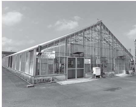
メロン水耕栽培実証試験施設

A 源泉の温度低下により冬季の水耕栽培を中止している状況。再開時期については気温が上昇する4月を予定している。