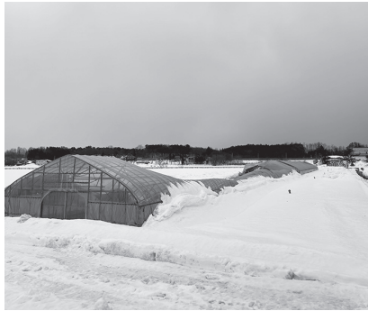
倒壊したビニールハウス （2月6日撮影、森田地区）