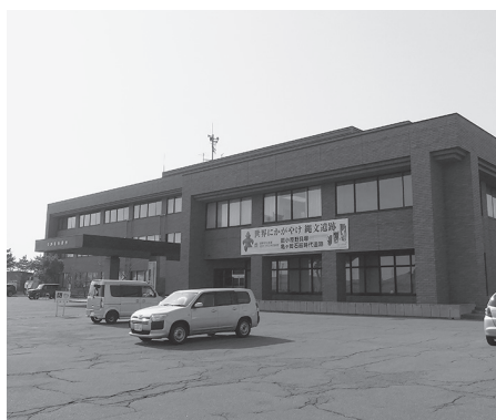
つがる市役所本庁舎

A 令和8年度から10年計画で改修工事を実施する。工事費の総額は約10億円となる見込みで、屋根や外壁、窓など緊急性の高い箇所から改修にとりかかる予定である。