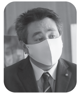
わたる さいとう 齊藤 渡 きしんかい 絆心会

答 有効な利活用の方法について検討中であり、関係部局等と協議を行い、令和3年度中には方向性を示したいと考えています。