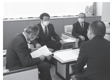
市民の安全・安心を最優先にするよう強く要望しました