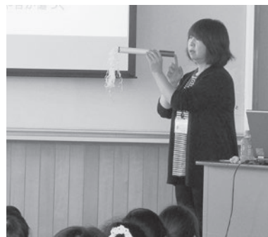
たばこの害を説明する保健師