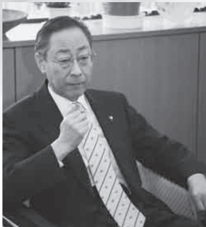
福島 弘 芳 市長