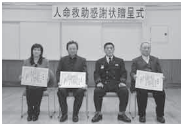
救急人命救助表彰者

これにより、女性は炎上している住宅から負傷もなく無事救出されたもので、消防隊が到着する前の火災現場という危険な状況にありながら人命を救う勇氣ある行動が、一名の尊い命を救いました。