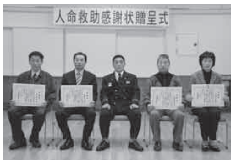
火災人命救助表彰者