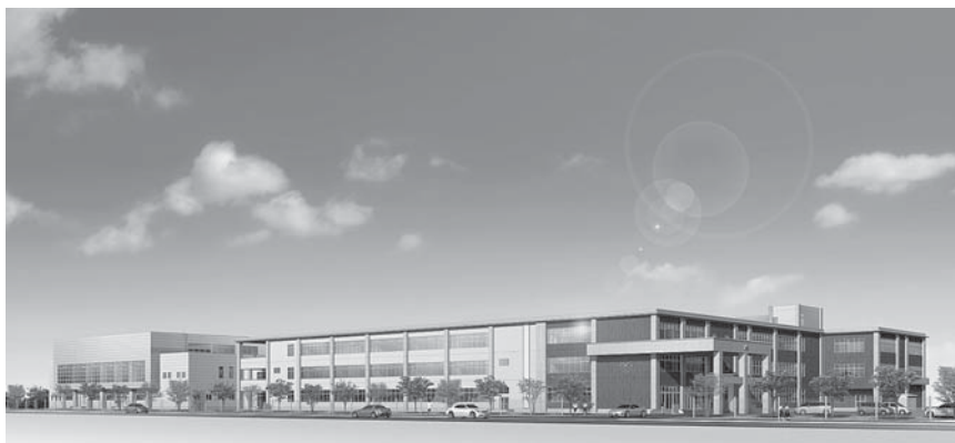
20年度完成予定、統合新木造中学校

本年が皆様にとりまして、幸多い年でありますことを心からお祈り申し上げます。新年のご挨拶いたします。