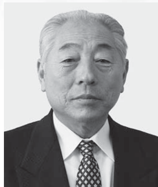
つがる市議会議長