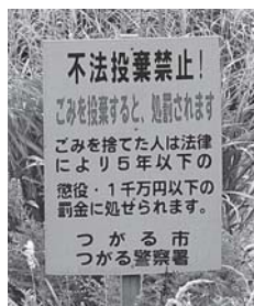
不法投棄の防止を呼びかける看板

つがる市では、不法投棄されたゴミを撤去した後の対策として、不法投棄の防止を呼びかける看板を立てたり、ロープを張ったりしています。また、現在では4カ所に監視カメラを設置して監視したり、定期的な巡回パトロールも行っています。