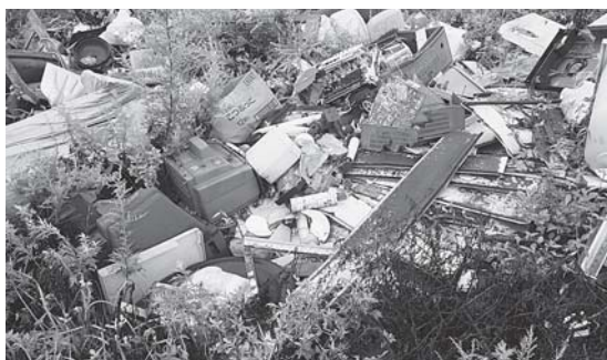
つがる市内の不法投棄現場

法律でも「廃棄物処理法」により不法投棄は禁止されており、5年以下の懲役又は、1000万円以下の罰金に処されるなど厳しい罰則が設けられています。