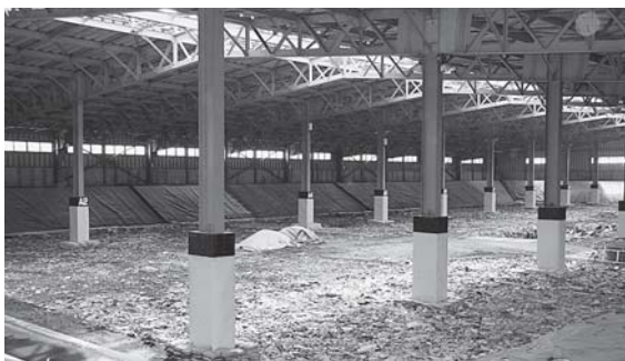
取材した木造・稲垣一般廃棄物最終処分場

処分に必要な経費も削減することが出来ます。そして効率的にリサイクルされることで、最終的には美しい自然を守ることにもつながるのです。