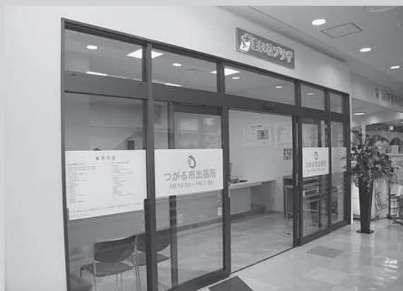
イオン柏出張所移設工事

財団法人つ小川原地域・産業振興財団から交付される原子燃料サイクル事業推進特別対策事業の助成金は、電気事業連合会からの寄付金によって賄われ、市の施設整備等に役立てられています。平成22年度の整備状況は次のとおりです。(総事業費75,111千円、うち助成金額74,670千円)