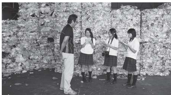
リサイクル現場を取材。後ろには圧縮されたペットボトル!

今回、私たちは、実際に不法投棄されている現場や家庭から出たゴミが最終的に処分されるまでの経路を取材してきましたが、どの施設の方々も、少しでも環境に優しく、効率的にゴミを処分するため、一生懸命に作業していました。その方々の努力を無駄にしないように、私たちはきちんとしたゴミの分別はもちろん、不法投棄を絶対させないような環境づくりを心がけなければいけません。そのような「当たり前のこと」を私たち一人一人が当たり前に行うことで、ゴミの量を削減することが可能になり、ゴミの