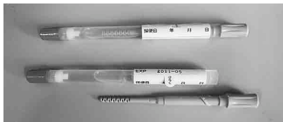
ピロリ菌感染診断検査 (自宅で便を採取して検査機関へ郵送するだけです)

市では、平成24年度から平成28年度まで、ピロリ菌感染検査と除菌治療の費用を全額助成（無料）しています。今年度の対象者は、昭和48年4月1日から平成5年3月31日生まれの方です。希望される方は、お電話でお申し込みください。