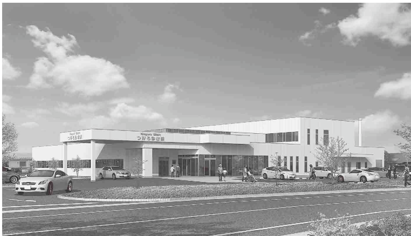
イラストは完成予想図です。診療所の名称は「つがる市民診療所」となります。

つがる西北五広域連合の自治体病院機能再編成計画に伴い、つがる成人病センターに代わり新築する「つがる市民診療所」の建設工事が平成24年12月から始まります。同診療所は、鉄骨造2階建て、延べ床面積は1,917.11㎡（診療所）、工事費（設計額）が6億8,281万5千円。入院設備のない無床の診療所で、地域住民に対する初期医療の提供、予防接種・住民健診への対応などの医療機能を有し、16人程度の職員（うち医師は常勤換算で1.9人）の配置を計画しています。また、患者送迎バスは、これまで通り運行を予定しています。