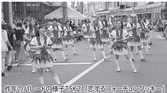
昨年のパレードの様子TSK21「恋するフォーチュンクッキー」

つがる市社会福祉協議会では、馬市まつり「馬ねぶたパレード」に仮装と踊り部門で、毎年参加しています。今年も趣向を凝らした仮装と踊りで、沿道のみなさまに楽しんでいただけるよう、現在、準備を進め、練習に励んでいます。みなさま、8月30日は、沿道での応援をよろしくお願いします。