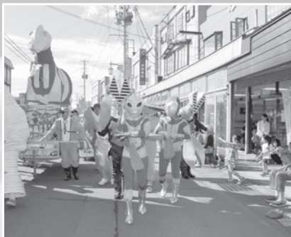
馬ねぶたパレード