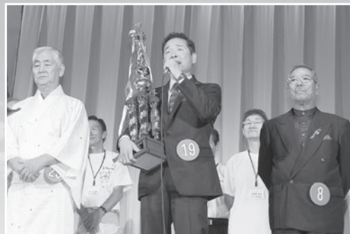
上原げんと杯争奪のど自慢大会

【問い合わせ先】 つがる市馬市まつり実行委員会 商工観光課 電話42-2111(内線432)