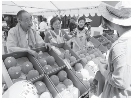
福島市長もメロンをPR！

もうすぐ恵みの秋ですね。つがる市自慢の農産物がたくさん採れる季節。みんなに味わってもらえるようにPRがんばります！