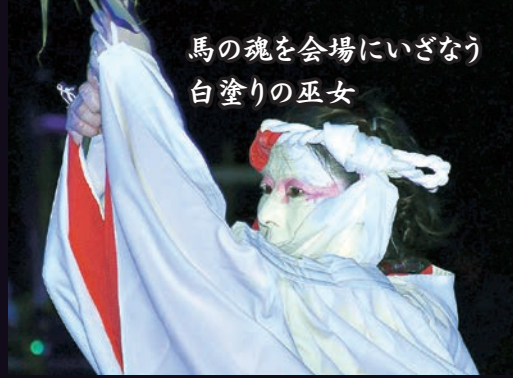
馬の魂を会場にいざなう 白塗りの巫女