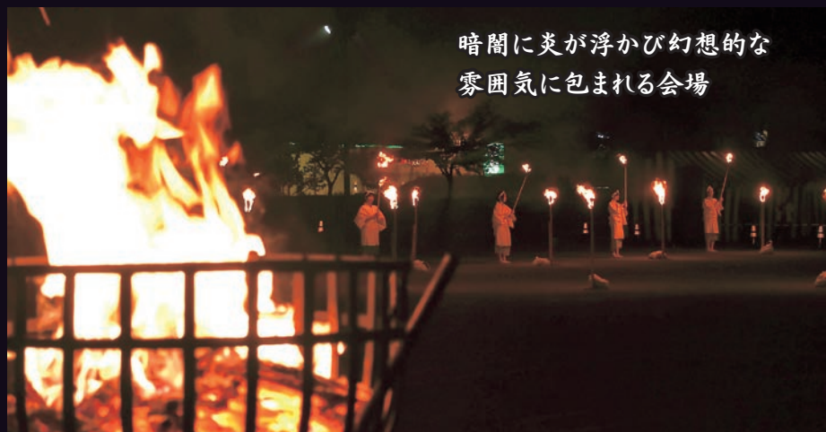
暗闇に炎が浮かび幻想的な 雰囲気にもまれる会場