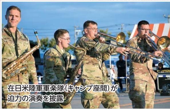
在日米陸軍軍楽隊(キャンプ座間)が迫力の演奏を披露