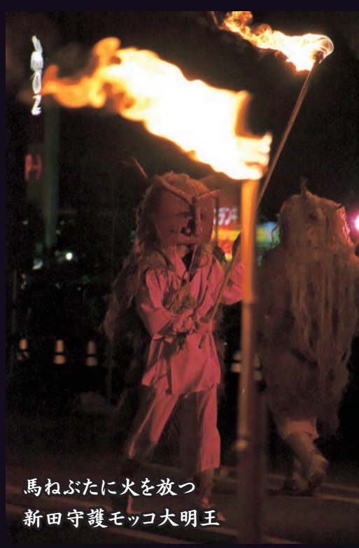
馬ねぶたに火を放つ 新田守護モッコ大明王