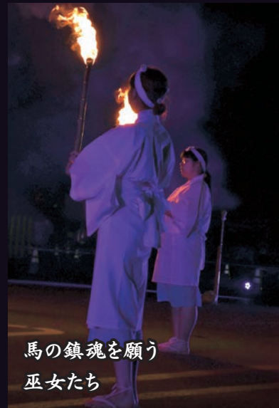
馬の鎮魂を願う 巫女たち