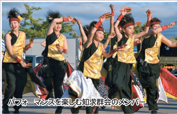
パフォーマンスを楽しむ知求群会のメンバー