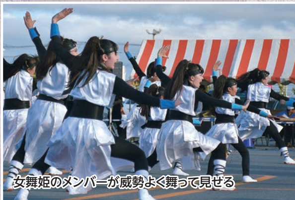
女舞姫のメンバーが威勢よく舞って見せる