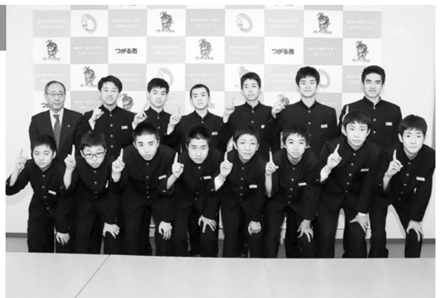
「ワンチーム」で優勝目指す!