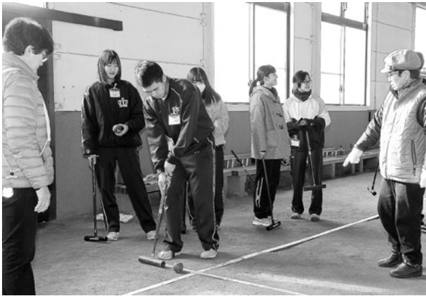
ボールの打ち方を教わる木造高生