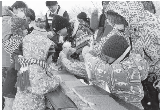
おいしいバナナポートになあれ!

会場では、津軽地域の道の駅など9つのブースが自慢の味を販売。よさこい知求群会の演舞などが行われたほか、氷の滑り台で勢いよくそり滑りを楽しむ子どもたちの姿が見られ、訪れた家族連れが楽しい1日を過ごしていました。