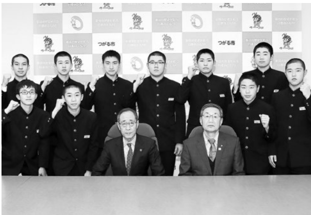
2月12日、福島市長と葛西教育長に健闘を誓ったメンバー