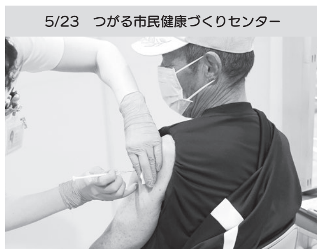
5/23 つがる市民健康づくりセンター

新型コロナワクチンの数は十分にあり、全市民が必ず受けることができますので、今しばらくお待ちください。