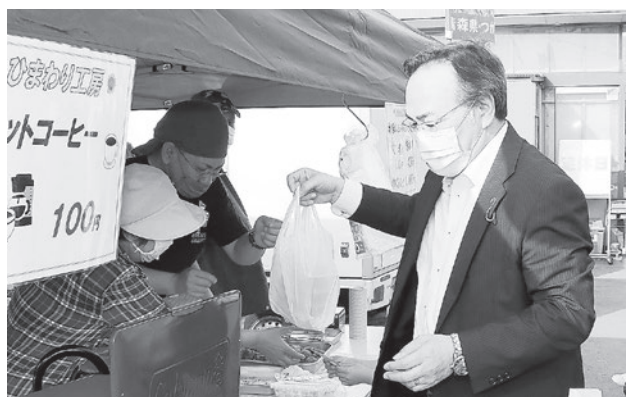
倉光市長もさっそく揚げたてのから揚げを購入

行列ができるほど大人気だったしじみ貝すくいどり。くじを引いて運が良ければスコップでしじみ貝をすくえる