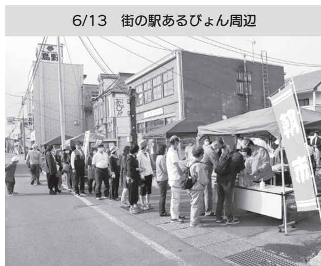
6/13 街の駅あるびょん周辺

朝市は、この日を含め10月まで計5回開催されます。早起きは三文の徳と言われますが、お得がいっぱいの朝市に出かけてみてはいかがでしょうか。