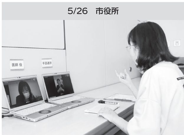
患者役(右)とパソコンの画面越しにやりとりする 医師役と手話通訳者

コロナ禍におけるろう者の不安や手話通訳者の戸惑いを少しでも軽減しようと、リモート（遠隔）での手話通訳体験を実施しました。