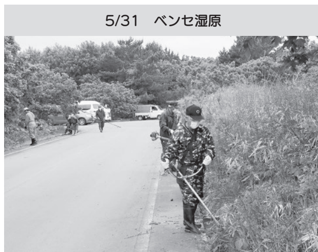
巧みに草刈り機を操る老人クラブの皆さん