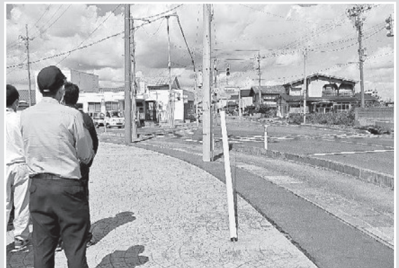
瑞穂小学校前交差点