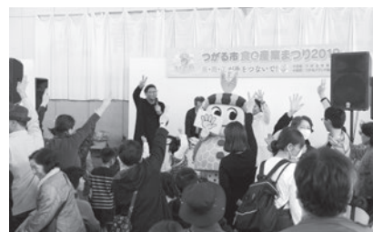
つがるちゃんとしゃんけん大会(2019年)