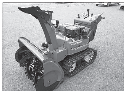
川除町内会（除雪機ほか）