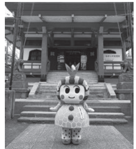
神楽坂 毘沙門天善國寺の前で