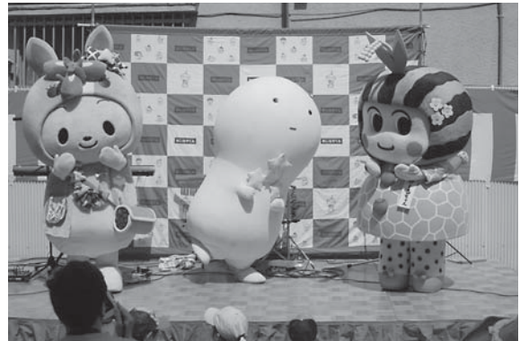
ステージ上で皆さんにPR

今回初めての参加でしたが、他のキャラクターたちのPRレベルの高さに圧倒されました。私ももっともっと頑張ります！