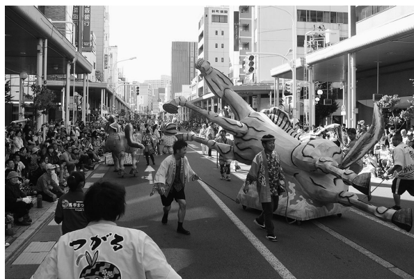
パレードコースを駆け回った菟中馬っこ愛好会

県内10市のまつり競演 あおもり10市大祭典 in AOMORI 県内10市の「祭り」、「食」、「芸能」が集結する「あおもり10市大祭典」が9月22日と23日の2日間、青森市で開催され、約25万人の来場者を魅了しました。 夜と昼の2回行われた「お祭りパレード」では、各市の祭りの山車や踊りなどを披露しました。つがる市からは「大畑馬ねぶた愛好会」、「菟中馬っこ愛好会」が参加。わらで制作された馬ねぶたや躍動感あふれる人馬一体型馬ねぶたなど9台が、囃子の音色と喧嘩太鼓のリズムに合わせてパレードコースを駆け回り、沿道の観客を大いに楽しませました。