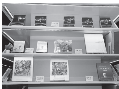
(写真左、上) つがる市と青森県ゆかりの著名人コーナー

さらに充実した竹内文庫のほか、図書館の一角には「つがる市ゆかりの著名人」と「青森県ゆかりの著名人」のコーナーを新設。地域が輩出した作家の作品や、著名人に関する書籍などが並んでいます。