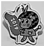
令和元年度のピンバッジ

10月1日から全国一斉に募金運動が始まります。つがる市では、つがる市共同募金委員会が運動を展開しています。今年は、新型コロナウイルス感染症の影響で羽根が不足しており、赤い羽根に代わりつがる市のマスコットキャラクターである、つがるちゃんと青森県共同募金会とがコラボしたステッカーを募金した方に配布することになります。みなさんのお宅へ「募金ボランティア(福祉推進委員等)」が訪問した際は、ご協力くださいますようお願い申し上げます。また、昨年度大変好評だった、つがるちゃんピンバッジにつきましても、10月1日より社協窓口にて行う予定です。