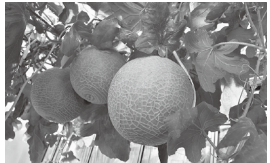
順調に生育中です