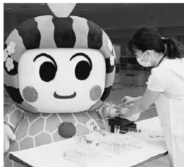
採血。糖尿病や脂質、肝機 能、痛風、貧血等、いろん なことがわかるよ。