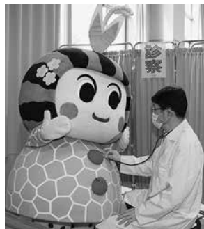
医師の診察。 先生はとても優しく たよ。