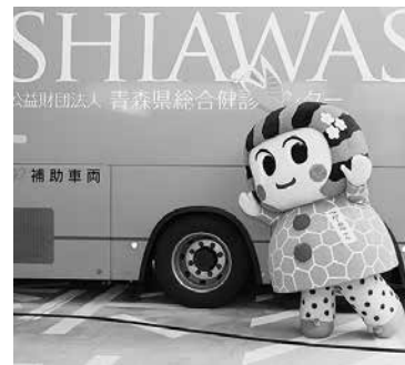
大きなバスが来て、一緒が ん検診もやってるよ。