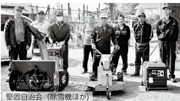
堅固自治会（除雪機ほか）

令和2年度の一般財団法人自治総合センター「一般コミュニティ助成事業」が、堅固自治会で実施されました。