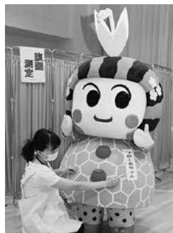
腹囲測定。 結果はヒ・ミ・ツ だよ。