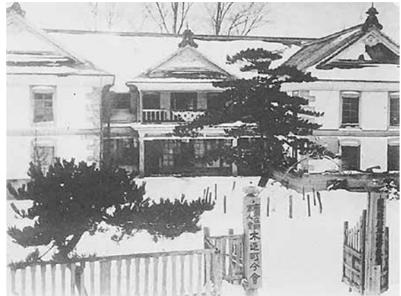
写真1 千代町校舎(町役場時代)

一方、明治17年(1884)に周辺十二村(現つがる市管内と旧水元村)の組合立で千代町に向陽高等小学校が開校します。当時は尋常科(4カ年、義務教育)を卒業した希望者が高等科(4カ年)に進学するもので、近隣唯一のものでした。その後、進学者の増加に対応し、有楽町を経て千年(現木造農村環境改善センターほか)に2回移転します。有楽町の校舎は明治35年から木造尋常小学校が使うこととなりましたが、両校は明治42年(1909)に統合され、木造町立向陽尋常高等小学校となります。校舎は高等小学校時代のままで、昭和46年(1971)に現校地の先代校舎へ移転するまで長く使われました。