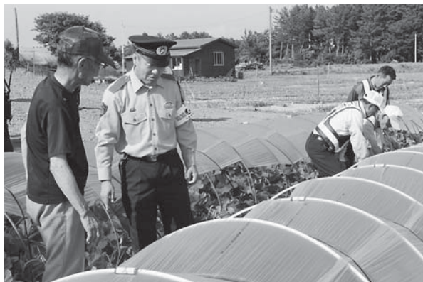
メロン畑を巡回する古川署長ら

古川昭治つがる警察署長は「去年はパトロールが功を奏し、盗難被害は無かった。今年も力を入れていく」と話していました。