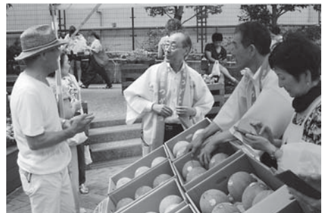
福島市長、天坂市議会議員がトップセールス