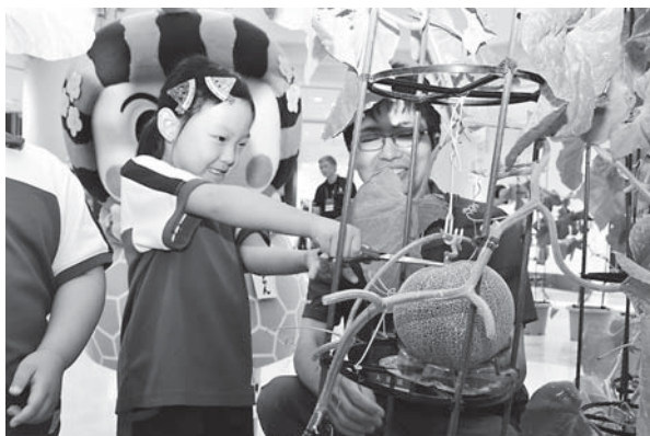
楽しそうにハサミを入れる園児

切れた。早くお家のみんなと食べたい」と、収穫を喜びました。同協議会の新岡さんは「この活動を機に多くの方々にPRできれば」と話していました。