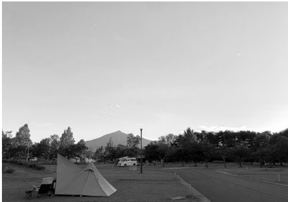
キャンプ場から見える岩木山

さて、春の訪れと言えば・・・、今回の広報つがるにも掲載していますが、春の陽気を感じられていそうです。3月27日に「空き家対策セミナー」を開催いたします。今年度の私の活動の集大成。どんな内容にしたら、よりよいセミナーになるか、試行錯誤しながら現在絶賛準備中です！お時間がある方はぜひお越しただけたらうれしいです。