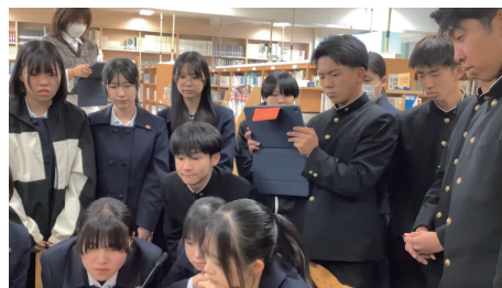
オンラインで交流をする生徒たち

2年生の「つがる市の魅力」について探究しているチームが、現在、台湾の高校(台南市私立慈濟高級中学)の1年生とオンラインで交流しています。11月6日の交流では、つがる市の魅力を伝えました。もちろん日本語ではなく英語です。そして台湾の高校もその地域の魅力を伝えてくれました。今後どのように展開していくのか楽しみです。