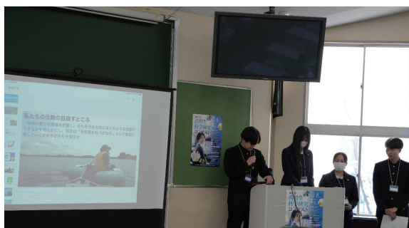
発表をする生徒たち

木造高校は、生物分野として「ガシャモク保全活動」をテーマに総探メンバーが発表しました。最優秀賞は逃したものの、SDGs賞を受賞しました。