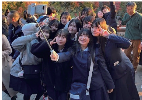
清水寺で記念に一枚