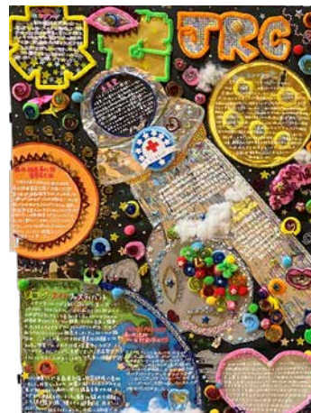
デコレーションされた 壁新聞

また、体験発表では原稿を一切見ずに堂々と、そして明るい表情で、まるで発表を楽しんでいるような聴衆の心をはぐちり掴み、今後も応援せずにはいられない見事な発表でした。