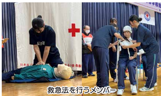
救急法を行うメンバー