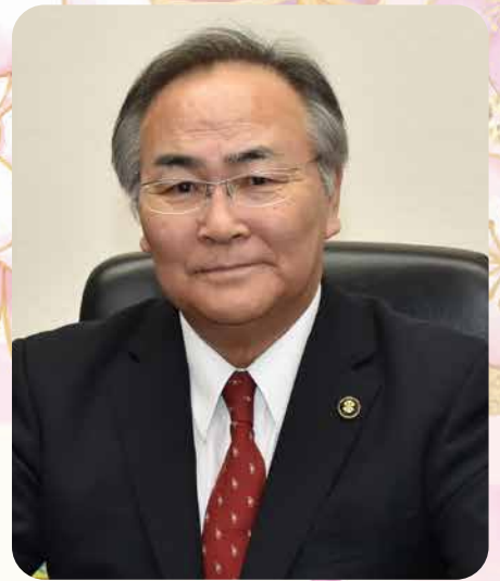
つがる市長 倉光 弘昭