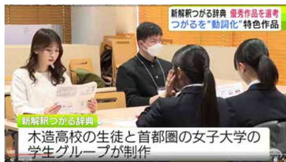
新解釈つがる辞典

この取り組みでは、「つがる」という言葉に新たな解釈を加えて動詞に変換します。そして、数多く動詞化して『新解釈つがる辞典』と称しました。2024年までで50の動詞化がなされ、今年度はその50作品の選考会が行われました。