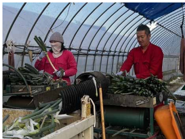
ネギの選別作業を頑張っています

最後の最後まで田んぼの集積に力を尽くし、【お米農家になる】という夢に向かって、歩みを進めていきます!