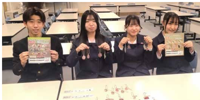
キーホルダーを手がけた4人のメンバー

この企画は、生徒たちが弘前市のアサヒ印刷がご当地カプセルトイ事業を展開していることを知り、会社訪問したことで実現しました。企画書の作成から、写真・デザイン使用や販売機設置の許可交渉も行い、キーホルダーの組み立てやカプセル封入にも携わりました。