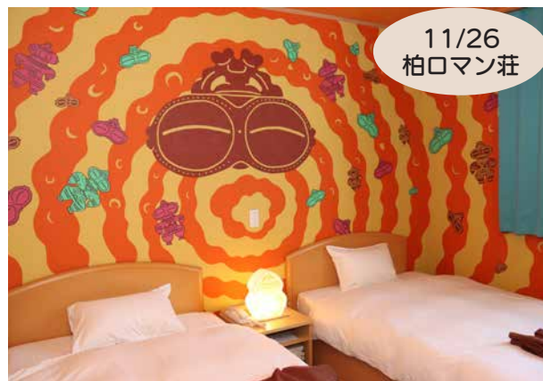
完成したしゃこちゃんコンセプトルーム

宿泊は1泊2食付きで、夕食にはつがる市産食材をふんだんに使用した「縄文膳」を用意するなど、縄文ロマンを味わいながら滞在を楽しめる内容となっています。