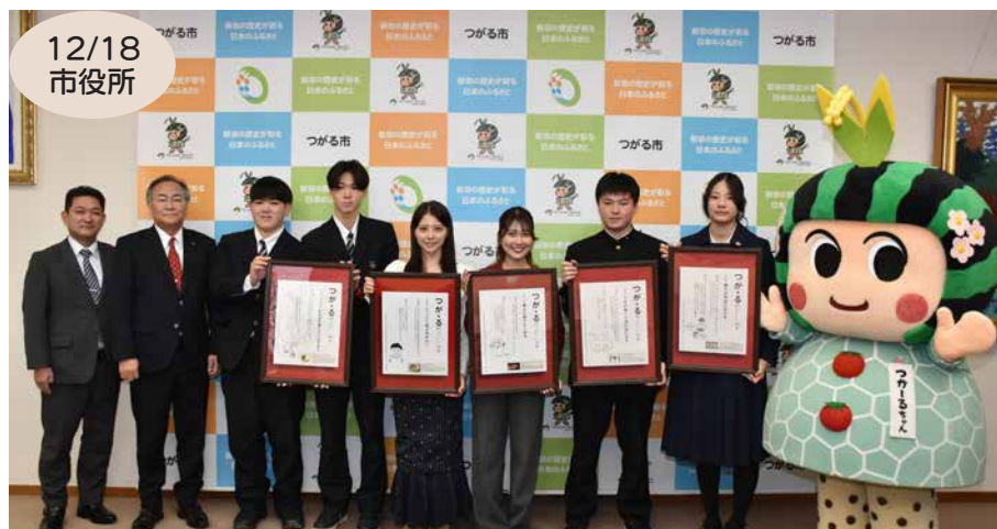
アワードの結果を報告した木造高校生とキャンパスラボの皆さん