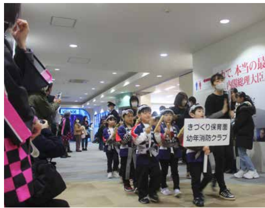
店内で「火の用心！」と呼び掛ける園児たち

パレード終了後は、イオンホールで「それゆけ！キッズ消防隊」「それゆけ！キッズ救急隊」をテーマにしたパフォーマンスを披露。日頃の練習の成果を元気いっぱいに発揮し、会場から大きな拍手が送られました。